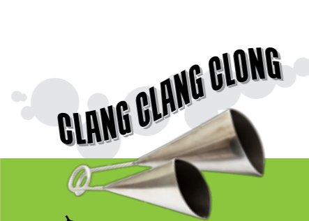
Ago-go bells: 'Groovy latijns-amerikaans instrument welk meteen een feeststemming creëert om op te dansen!

Percussiegroep Zinvol Geweld; een opmerkelijke naam! Geweld is zinloos, maar muzikaal 'geweld' zorgt voor positieve en zinnvolle energie. Met geweldige muzikale prestaties... dat heeft 'Zinvol Geweld' bewezen.