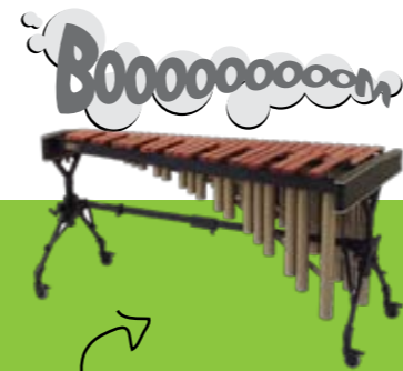
Marimba: 'Een aan de xylofoon verwant muziek- instrument, maar met een veel warmere en vollere klank. Met diverse soorten mallets wordt de klank bepaald.'