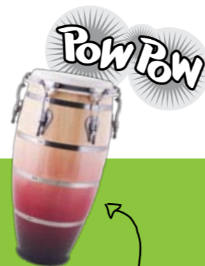
Conga: 'Dikbuikige Cubaanse éénevellige trommel met een krachtig karakter. Voor een warme volle klank en te bespelen met vingers of handpalm'